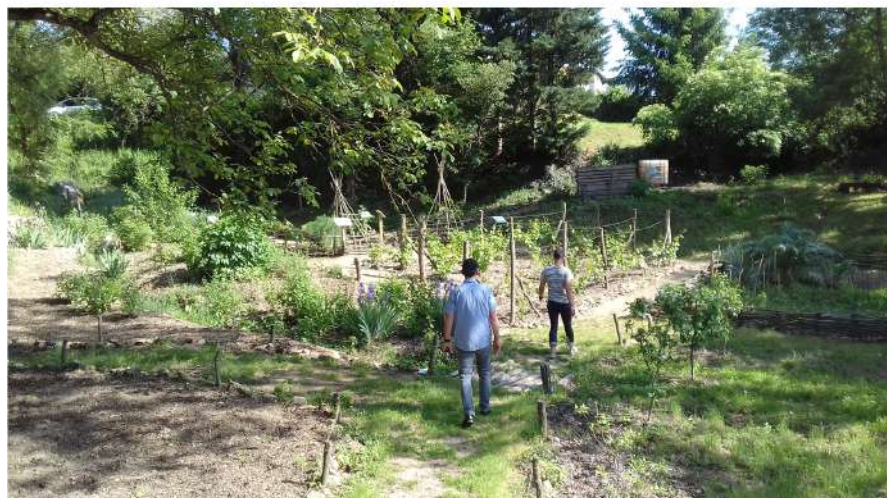
Jardin médiéval de Salt-en-Donzy